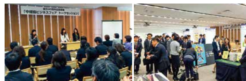
40周年記念「中経協ビジネスフェア」