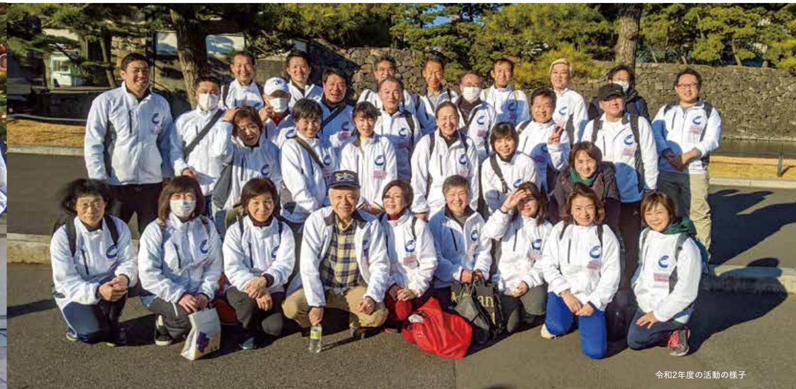
令和2年度の活動の様子