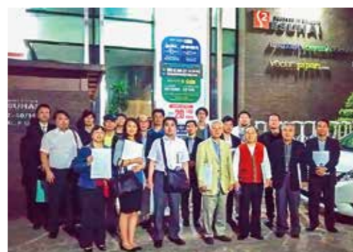
リアル・アジア視察 in ベトナム