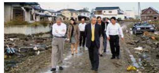
東日本大震災被災地訪問 石巻市の住宅街にて