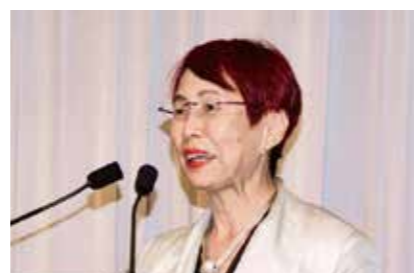
上野 千鶴子 氏