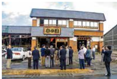
宮城県石巻市 木の屋石巻水産