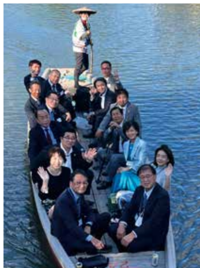
第6回合同例会 川下りの様子