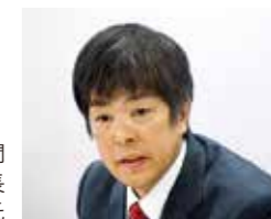
注目企業訪問 (株)ジャパネットたかた社長 高田明氏