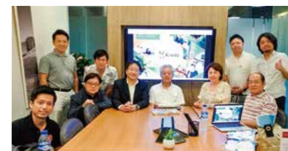
リアル・アジア視察 in フィリピン