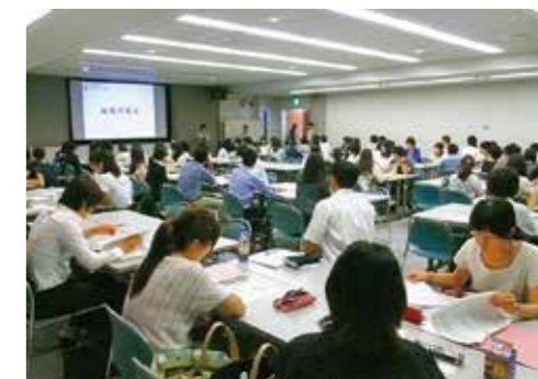
キャリアスクーププロジェクト