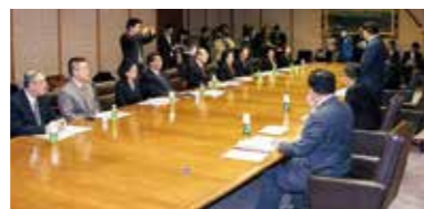
福岡県知事麻生渡氏との意見交換会