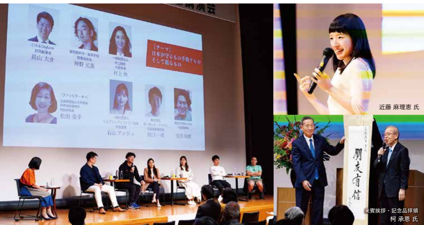
近藤 麻理恵 氏