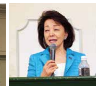
Nextステージフォーラム 講師 ジャーナリスト 桜井よしこ氏