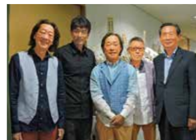
博多座貸切公演 「梅と桜と木瓜の花」の出演者と