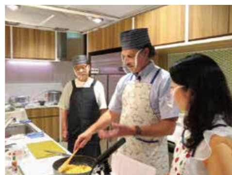
第292回例会で料理を披露する 在米領事館首席領事 テイラー氏