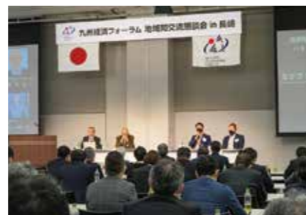
九州経済フォーラム「地域間交流懇談会 in 長崎」