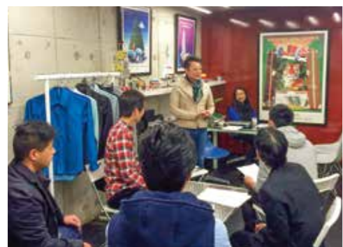
第1回「男塾・女磨き塾」