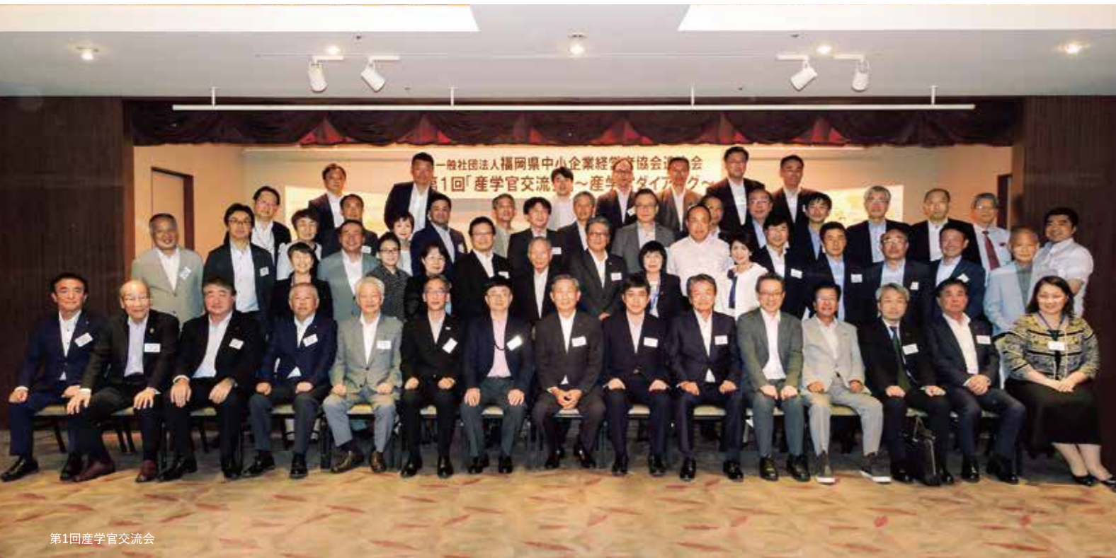
第1回産学官交流会