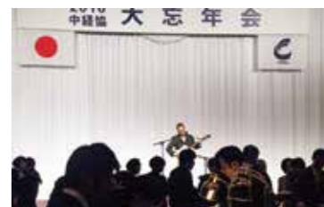
2010年 中経協大忘年会