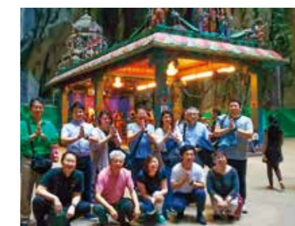
リアル・アジア視察 in マレーシア