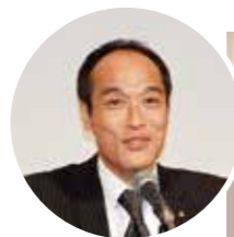
第179回例会 講師 宮崎県知事 東国原英夫氏