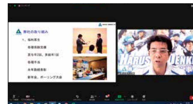
福岡市オンライン合同会社説明会