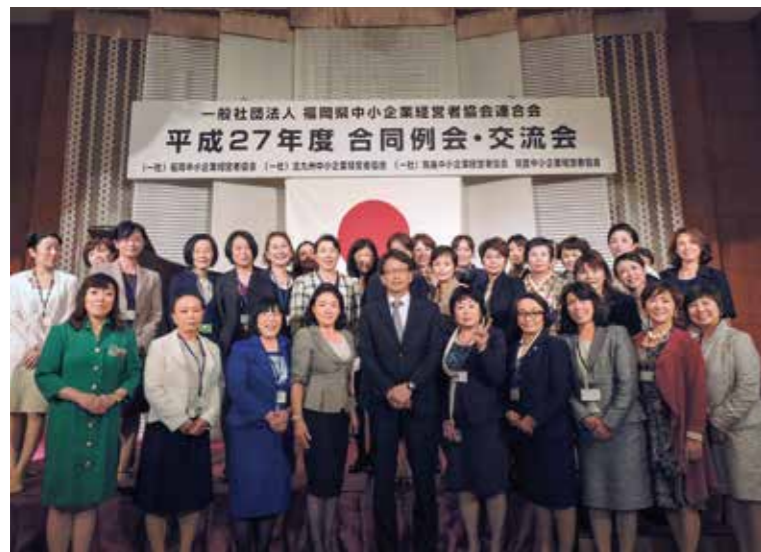
第1回合同例会 講師 内閣府副大臣 平 将明氏を囲んで