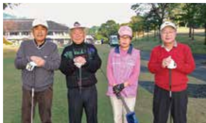
創立40周年記念 会員親睦チャリティーゴルフ大会