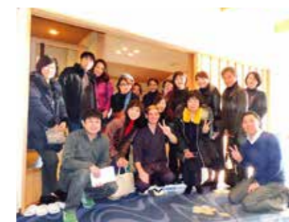
波佐見町散策ツアー