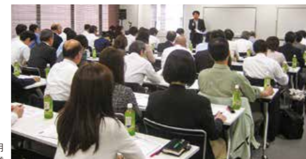
希望者全員65歳雇用 確保達成事業