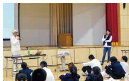
チャレンジマインド育成事業