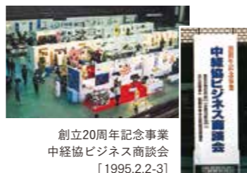
創立20周年記念事業 中経協ビジネス商談会 [1995.2.2-3]