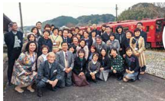
Nextステージフォーラム 平成筑豊鉄道