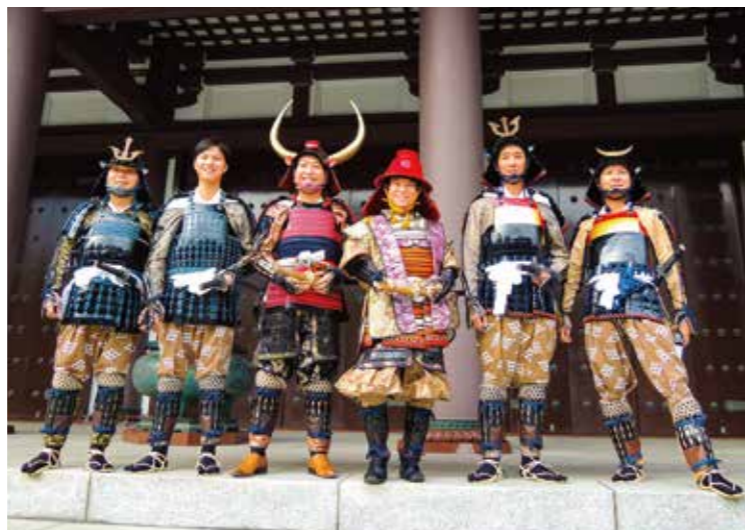
第224回例会は立志会が甲冑姿で運営を担当