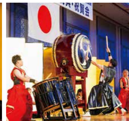
余興 和楽団ジャパマーベラス