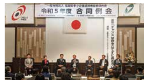
第7回合同例会 各会長によるパネルディスカッション