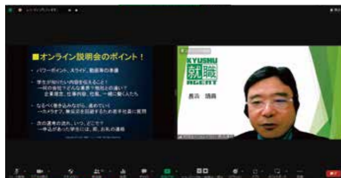
中小企業採用ノウハウ向上事業