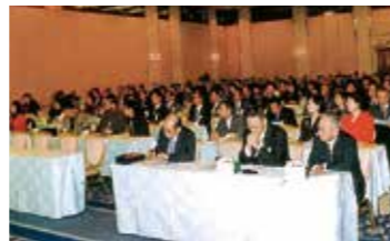
創立30周年記念式典・祝賀会 [2004.6.2]