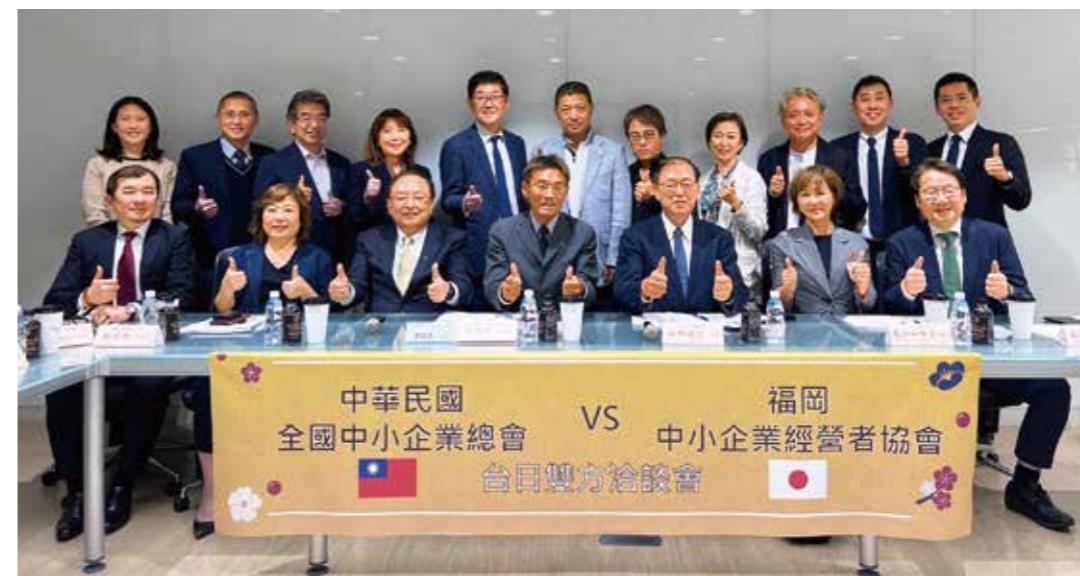
2024MeetTaipei視察&台湾企業ビジネス訪問