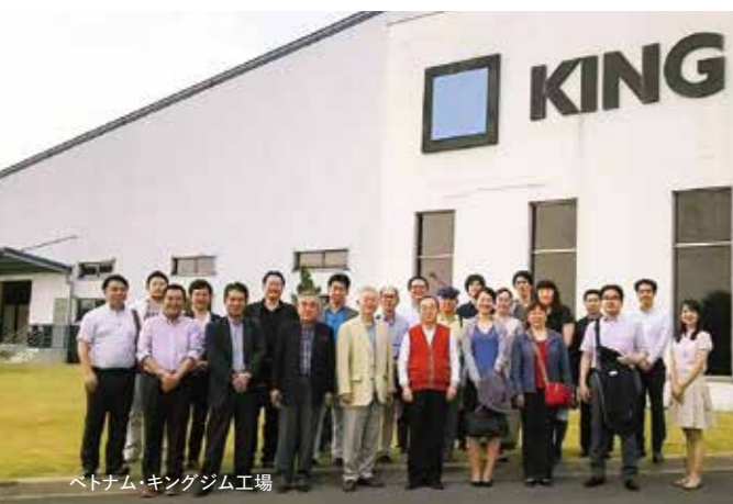
ベトナム・キングジム工場