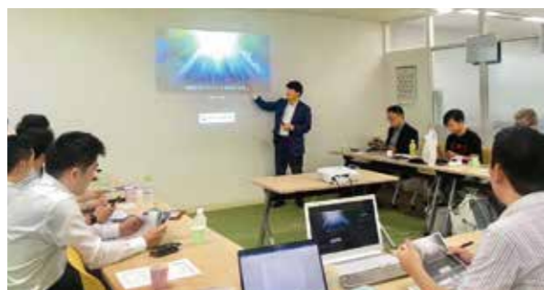
メガベンチャー創出支援プロジェクト