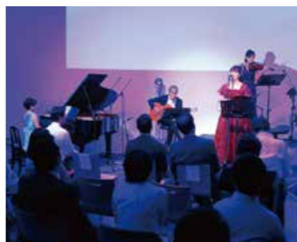
第309回例会 「唄で知る日本のこころ」 童謡・唱歌コンサート