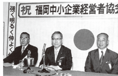
設立総会で選任された正副会長