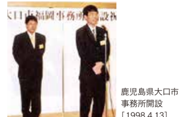
鹿児島県大口市 事務所開設 [1998.4.13]