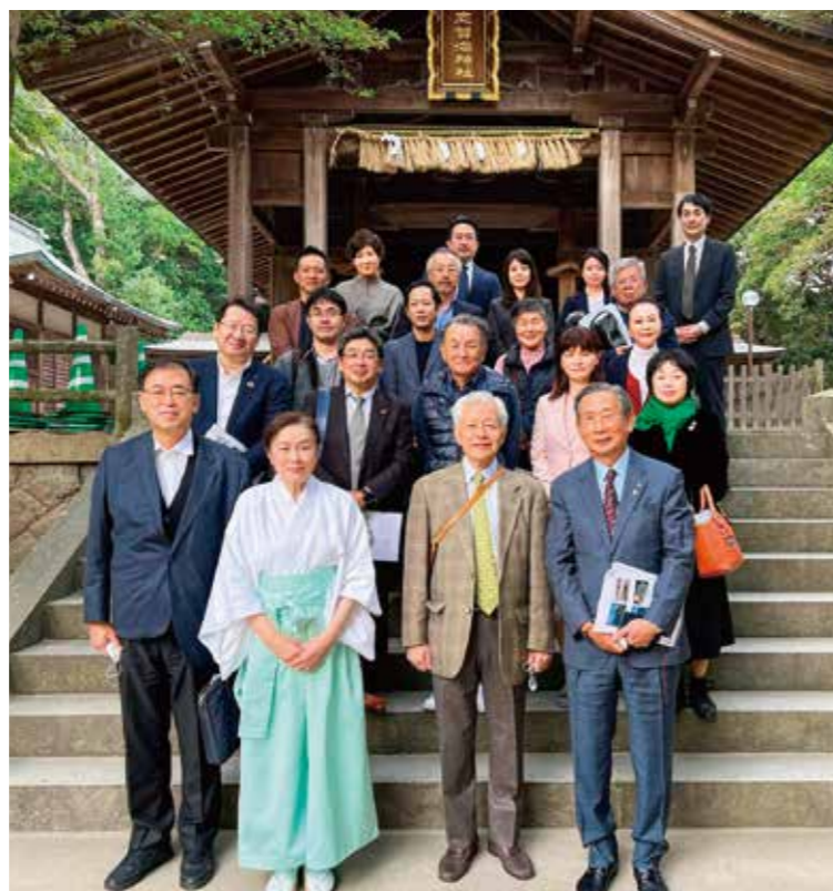
志賀島歴史学びツアー