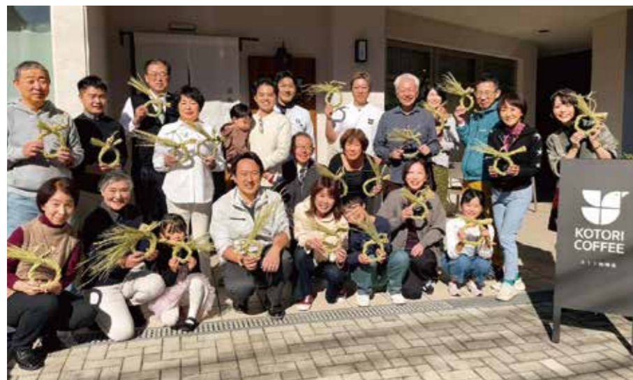
次世代プロジェクト しめ縄づくり体験会