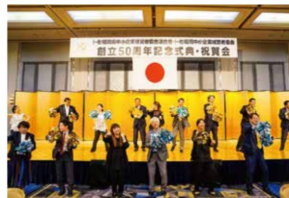
余興 精華女子高等学校吹奏楽部OBバンド