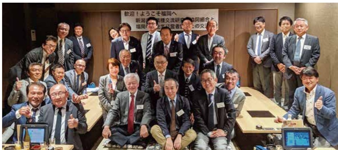
新潟異業種交流団体との交流会