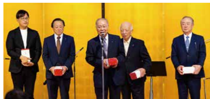
設立会員へ記念品贈呈