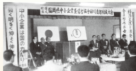
田川支部結成大会