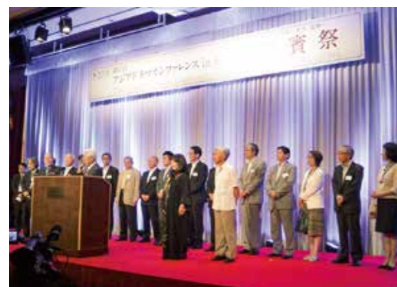
第7回東アジア放送作家カンファレンス 「2008 in KYUSHU～福岡前夜祭～」