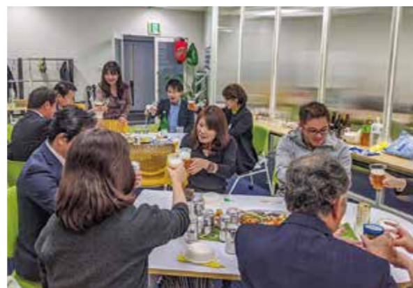
スナックちうちう開店