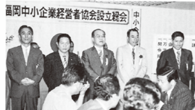
設立総会での役員紹介