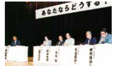
15周年記念シンポジウム [1989.10]