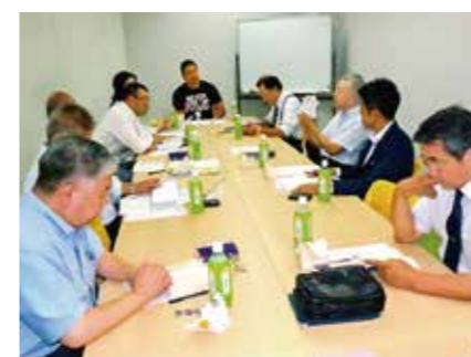
経営者としての見識を深める勉強会 吉田松陰・講孟筭記勉強会