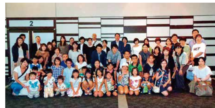
美女と野獣ファミリー観劇会