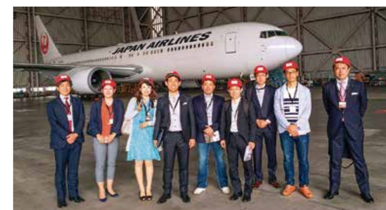
JALスカイミュージアム視察