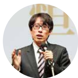
創立40周年記念 特別講演会 講師 作家 竹田恒泰氏