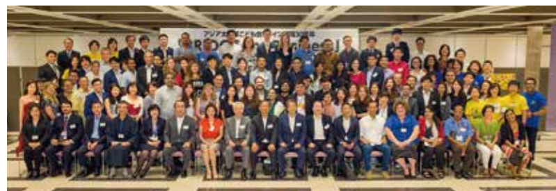
ビジネス交流会「BRIDGE for Business」