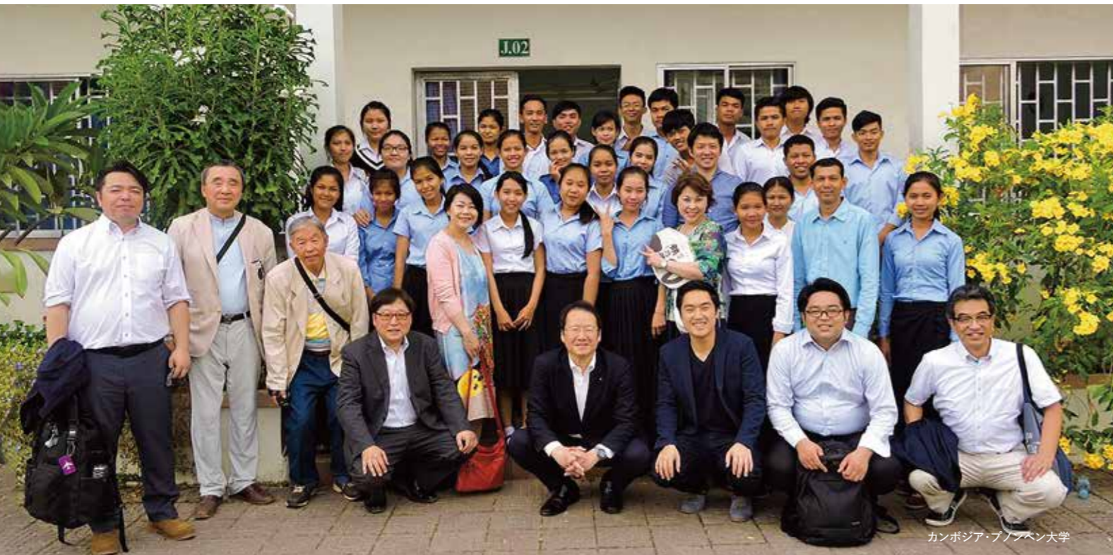
カンボジア・プノンベン大学