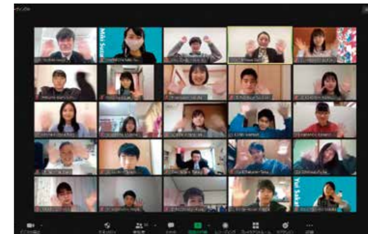
福岡未来創造キャンプ On Your Mark(オンライン開催)