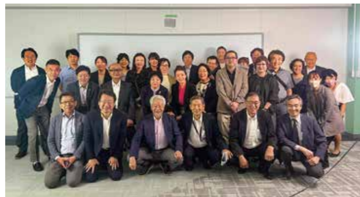
小中一貫校志明館視察会