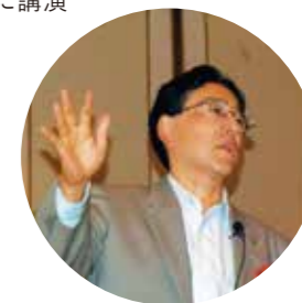
第216回例会 講師 日本総合研究所 藻谷浩介氏