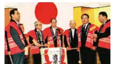
創立25周年記念式典・祝賀会 [2000.1.5]