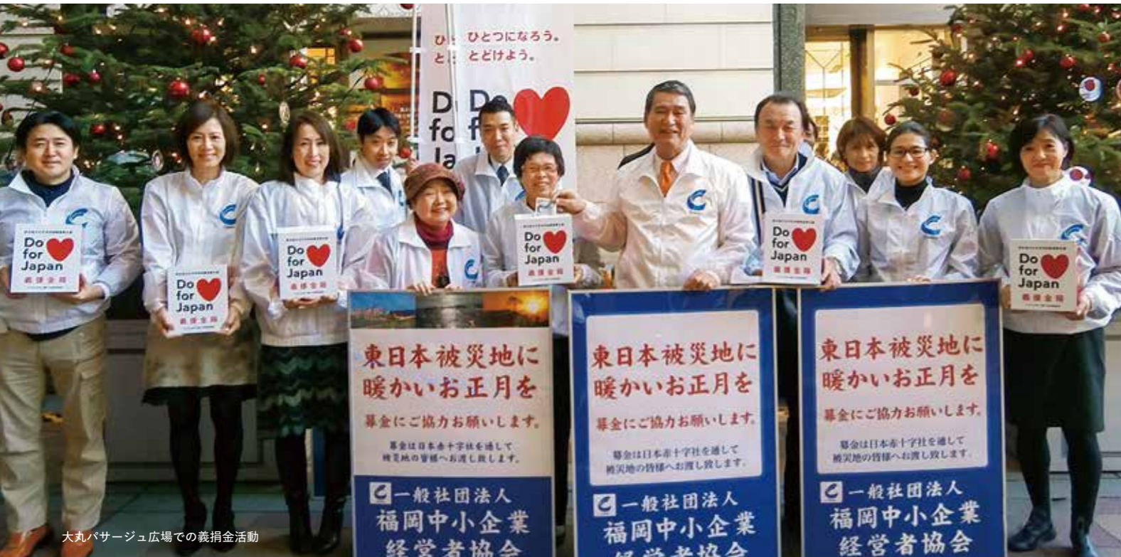
大丸パサージュ広場での義捐金活動