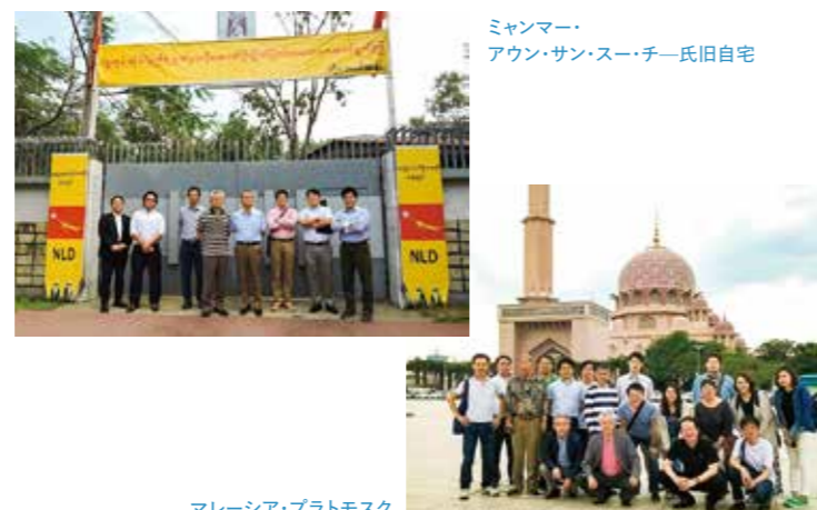
ミャンマー・ アウン・サン・スー・チー氏旧自宅