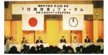
第131回例会 「行政改革」フォーラム&シンポジウム [1997.9.5]