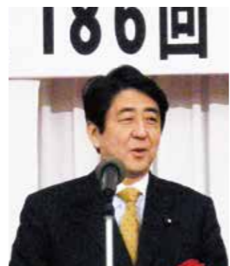
第186回例会 元内閣総理大臣 安倍晋三衆議院議員が講演