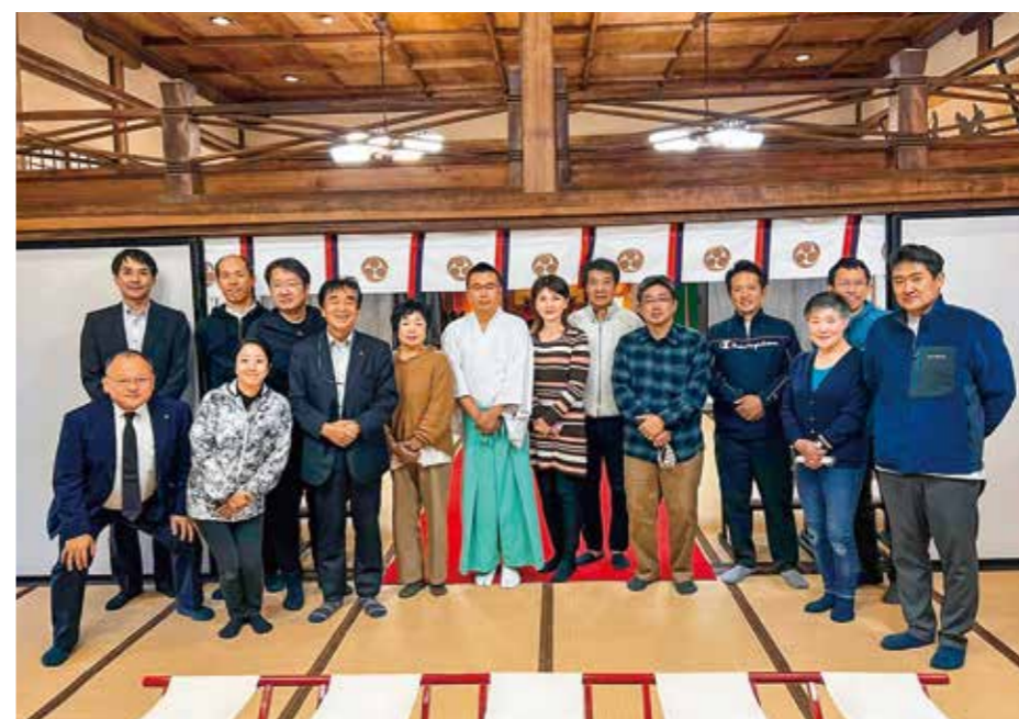
住吉神社奉仕活動