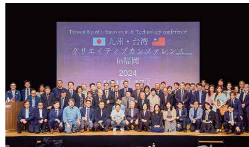
九州経済フォーラム「九州・台湾クリエイティブカンファレンス in 福岡」