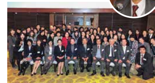
Nextステージフォーラム