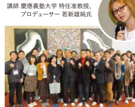
地方創生コンファレンス