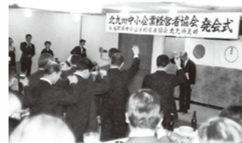
北九州支部発会式