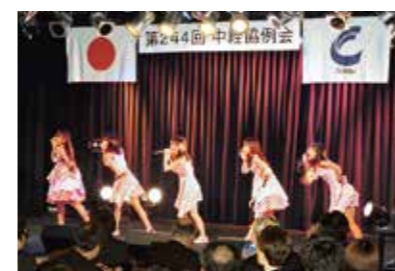
ゲスト アイドルグループ「LinQ」