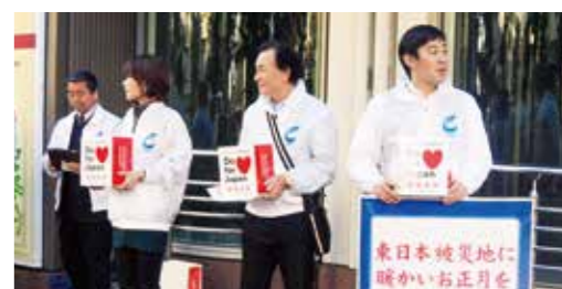
東日本大震災被災地復興支援「歳末助け合い募金活動」