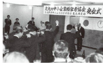
北九州中小企業経営者協会北九州支部 発会式 [1981.3.30]