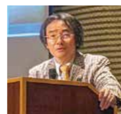
第50回定時総会 講師 作家、ジャーナリスト 門田隆将氏