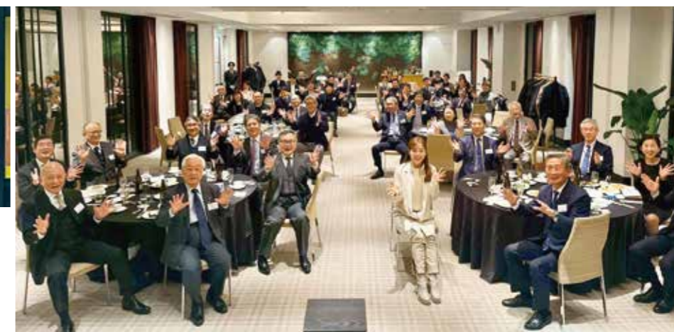
第12回産学官交流会