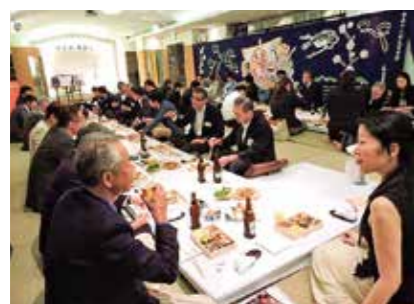
宮崎宮放生会幕出し交流会