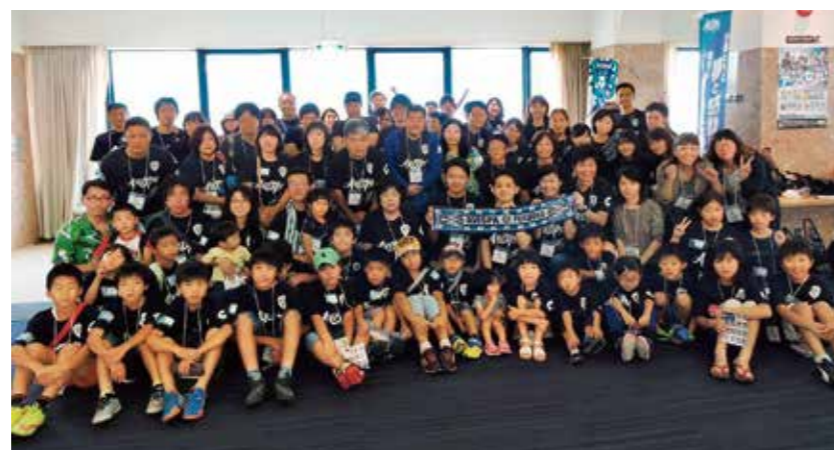
アビスパ福岡 ファミリー観戦交流会