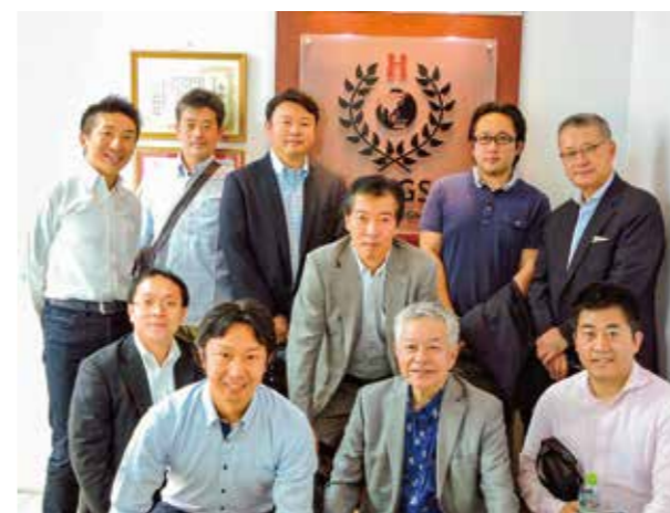
リアル・アジア視察 in カンボジア・ミャンマー