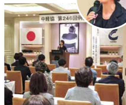
講師 オリンピックマラソンメダリスト 有森裕子氏