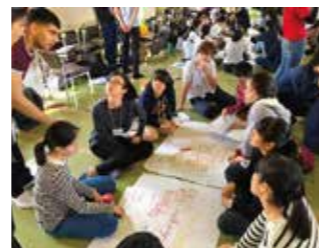
福岡未来創造キャンプ On Your Mark