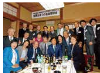
四中経協会長会議 知事公舎での役員懇親会