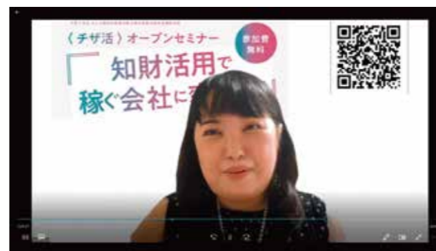
中小企業知的財産活動支援事業