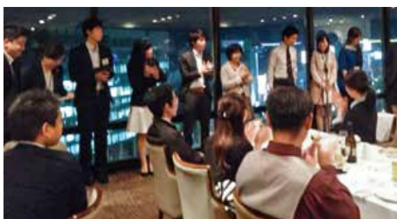
第1回 婚活パーティー