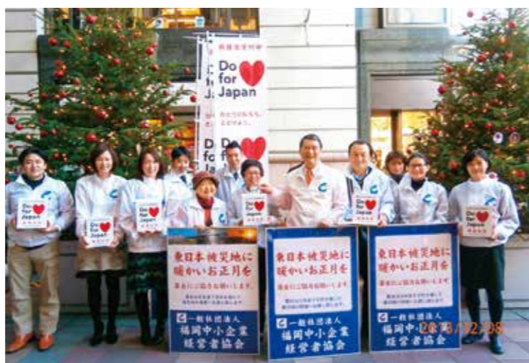
東日本被災地支援募金活動