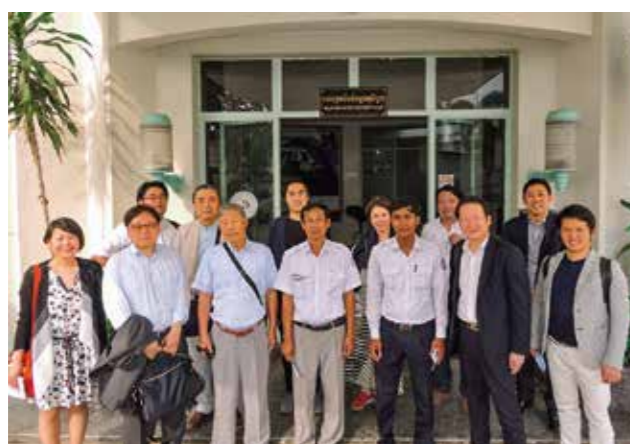
リアル・アジア視察 in カンボジア