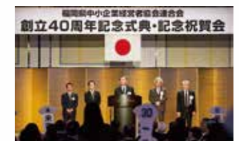
◆ 中経協連合会、社団法人認可