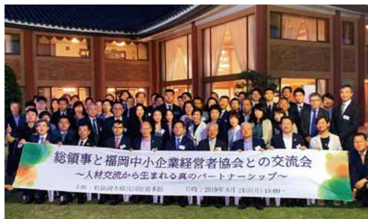
駐福岡大韓民国総領事館との交流会