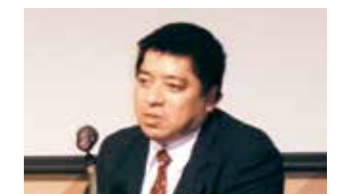
第174回例会 講師 外務省元主任分析官 佐藤 優氏