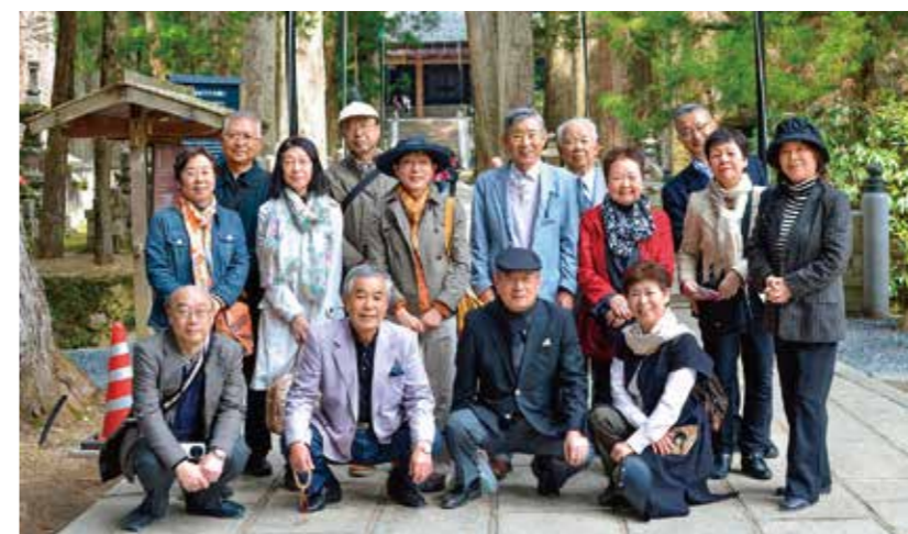
伊勢神宮参拝ツアー