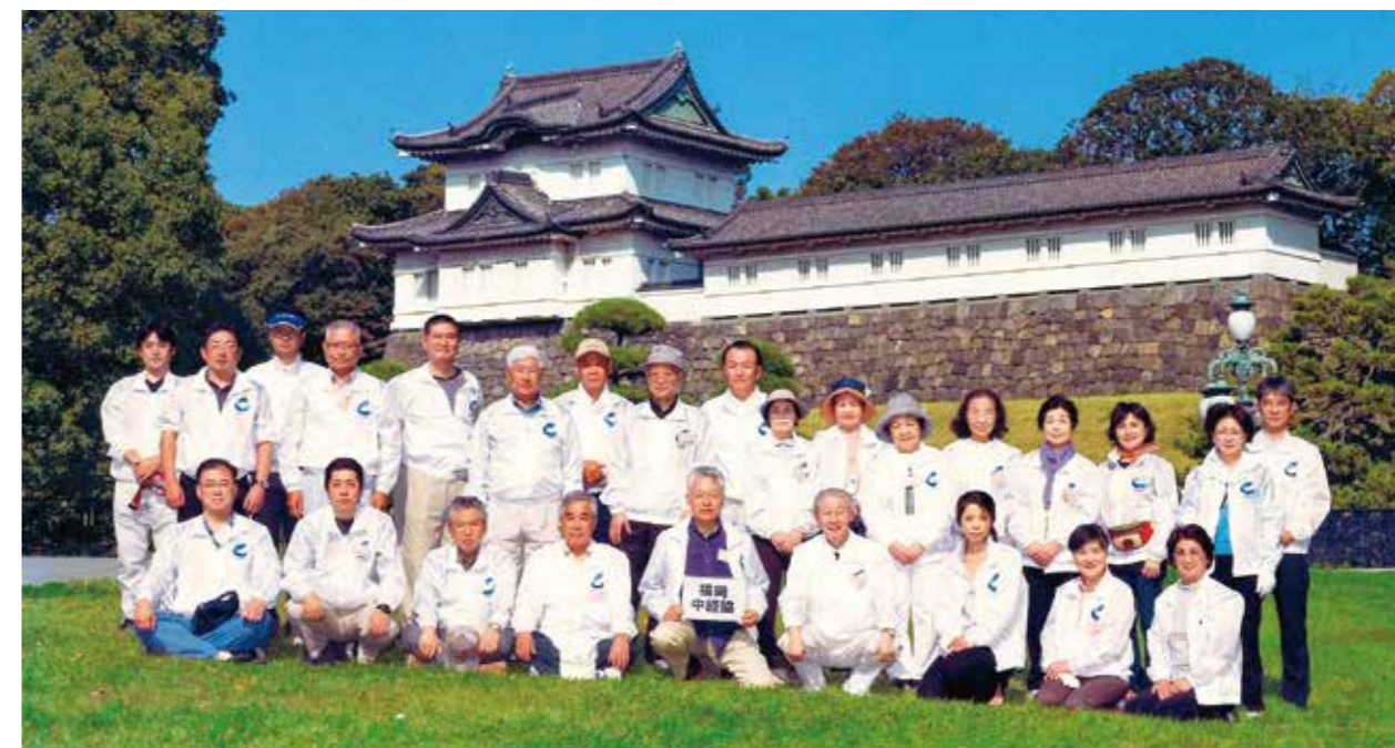
皇居勤労奉仕活動