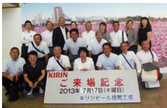
会員交流委員会でキリンビール工場を視察