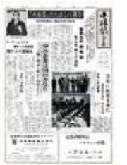
「中経協ニュース」 タブロイド版 [1974.8.15]