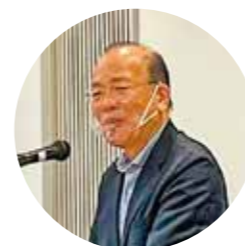
作家、神渡良平氏の講演会