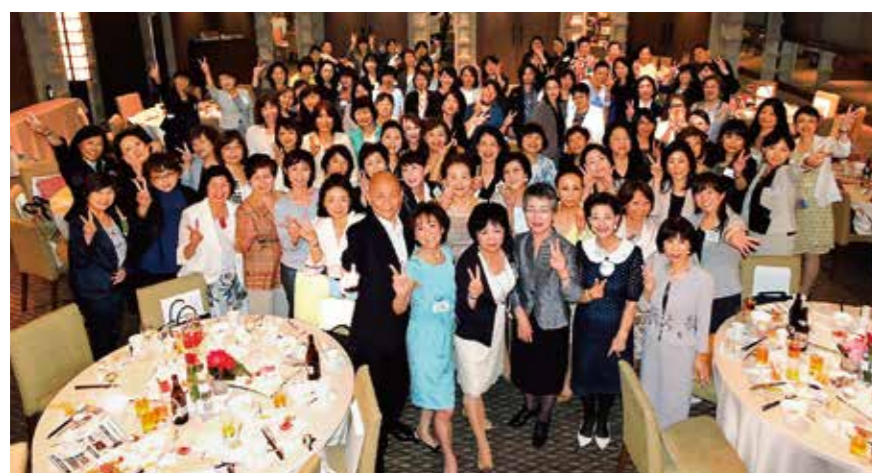
第1回経営者&管理職「女子会」