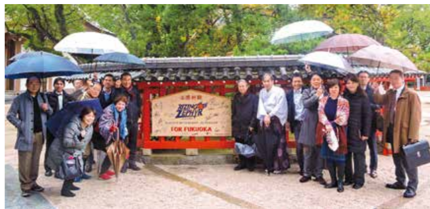
博多文化勉強会・箱崎散策ツアー