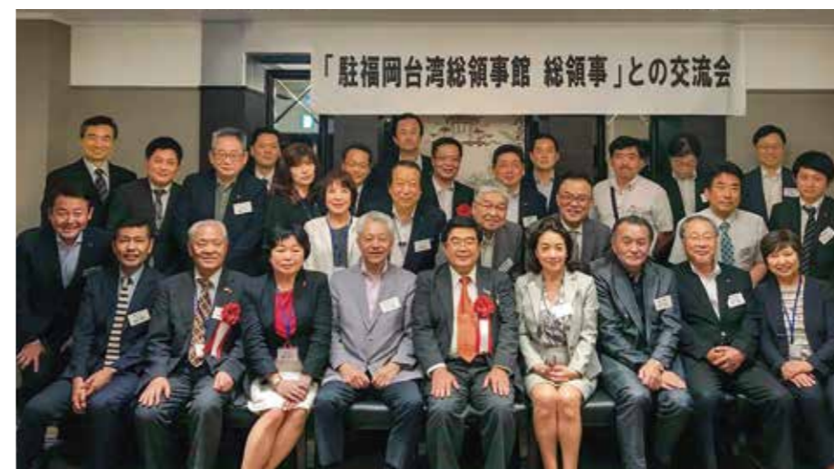
台北駐福岡経済文化辦事處との交流会