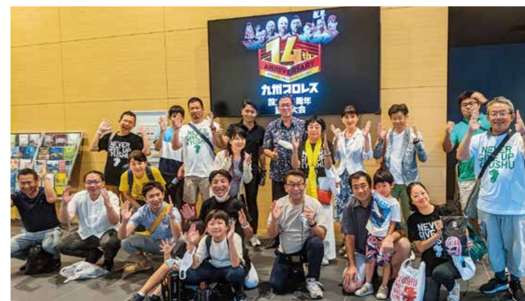
九州プロレス観戦会