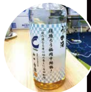
「AWARD」 メッセージ入り記念品