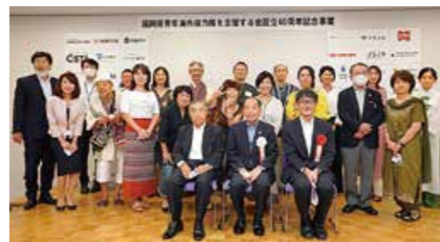
福岡県青年海外協力隊を支援する会 創立40周年記念式典