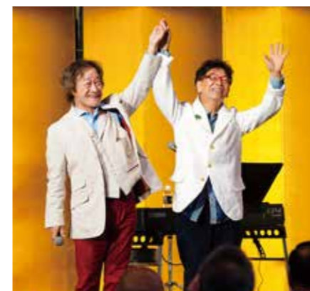
南こうせつと武田鉄矢による記念公演