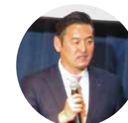
第304回例会 講師 元福岡ソフトバンクホークス投手コーチ 倉野信次氏