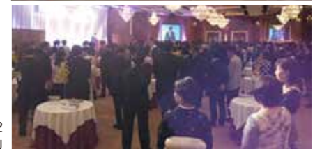
東アジア放送作家カンファレンス2012 in KYUSHU