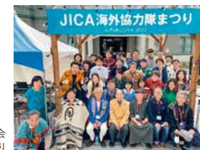
福岡県青年海外協力隊を支援する会 協力隊まつり