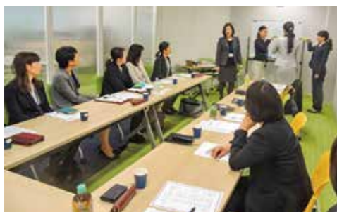
女性管理職育成セミナー