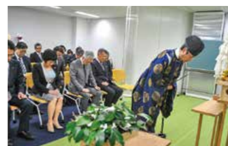
エルガーラに事務所移転