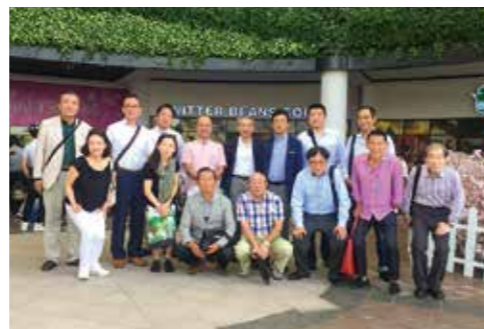
ベトナム・ハノイ 視察ツアー