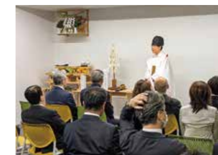
久原本家天神ビルへ事務所移転