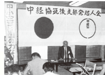
筑後支部発起人会