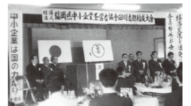
田川支部設立総会 [1978.2.8]