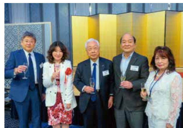
九州経済フォーラム 講師 元内閣府特命担当大臣 片山さつき参議院議員(左から2番目)