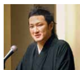
第180回例会 講師 歌舞伎俳優 中村獅童氏