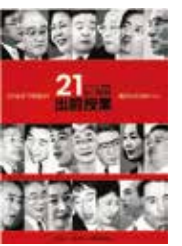
創立25周年記念 「21人の社長 出前授業」 実施 [1999.7.9]